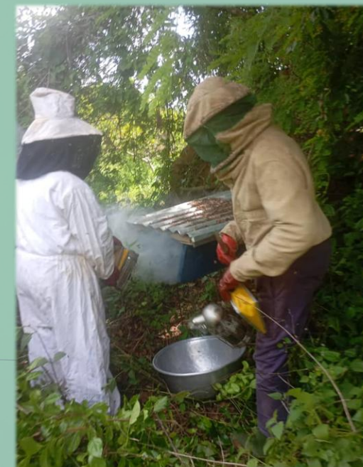
Récolte de miel avec le formateur en apiculture

Au total, ce sont plus de 2000 producteurs.ices qui sont appuyé(e)s et encadré(e)s grâce à un conseil-agricole de proximité par nos 6 agents de terrain, basés directement dans les villages.