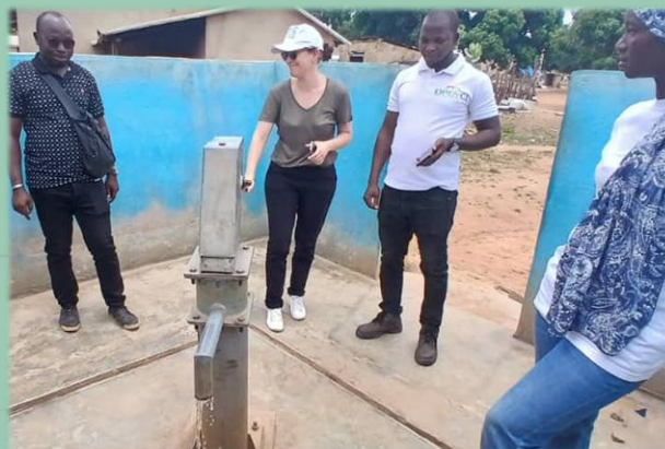
Construction d'une pompe hydraulique dans le village de XXX

Afin de renforcer le développement local et l'accès aux infrastructures de bases, le projet élargi l'élaboration de Plans de Développement Locaux (PDL) pour les villages bénéficiaires (12 sur PapBio1 ; 15 sur phase 2). Effectués de manière participative et inclusive , ces PDL ont pour but de recenser les besoins prioritaires de chaque village, et de les inscrire aux plans triennaux des Conseils Régionaux. Le projet finance ensuite une infrastructure prioritaire par village , afin d'apporter sa pierre à l'édifice du développement local. A noter que des membres des Comités de Développement Locaux (CDL) ont été nommés et formés pour un meilleur suivi des investissements et une meilleure capacité à monter des projets futurs pour leurs villages .