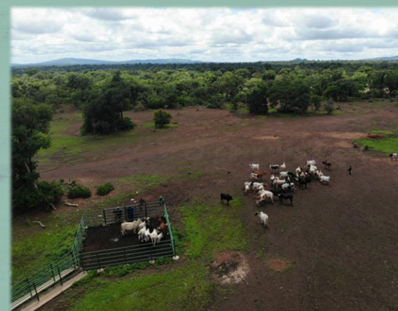
Une aire de repos dans la zone de Gawi.

Le Nord de la Côte d'Ivoire, traversé par les flux transhumants sous-régionaux et abritant plusieurs milliers d'éleveurs, se heurte à l'insécurité du foncier rural et à la mobilité du bétail . La discontinuité des voies de passage oblige les éleveurs à traverser des zones cultivées ou à se replier dans les espaces protégés. La sécurisation de pistes à bétail, réalisée sur PapBio1, a été élargie sur cette seconde phase avec l'identification de nouveaux tronçons dans la sous-préfecture de Fombolo. Afin de les rendre fonctionnelles et praticables, ces pistes sont systématiquement dotées d' infrastructures pastorales , (points d'eau, aires de pâture...). A noter que cette activité, confiée à l'OPEN-CI, contribue également au renforcement de la cohésion sociale entre agriculteurs et éleveurs en réduisant les tensions foncières et les dégâts de culture.