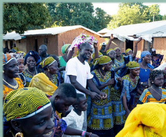
Concertation des populations à Dombadougou.

Dans le souci d'améliorer la gestion de l'espace, des ressources et de réduire les conflits fonciers, le projet s'est focalisé sur un renforcement de la cohésion sociale , auprès des populations et des acteurs de la conservation (OIPR, SODEFOR, AGEREF). De manière concrète, le changement de statut de la Zone de Biodiversité (ZDB) des Monts Tingui en Réserve Naturelle Volontaire (RNV) devrait représenter une amélioration majeure dans la préservation des espaces périphériques au PNC (initiative soutenue par la GIZ et les partenaires publics). De plus, des Plans d'Usage des Terres (PUT) pour les communautés bénéficiaires ont été réalisés afin de mieux planifier l'usage du domaine villageois (agriculture, élevage, foncier...) et durabiliser son exploitation face à la progression des superficies agricoles.