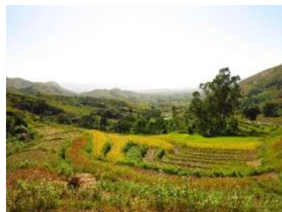
Sary 1 : karazam-panajariana ny tany eo anivon'ny faritry ny tetikasa